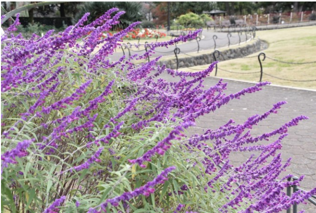
↑アメジストセージ 日比谷公園