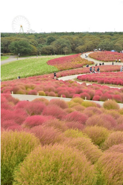
↑コキア畑 ひたち海浜公園