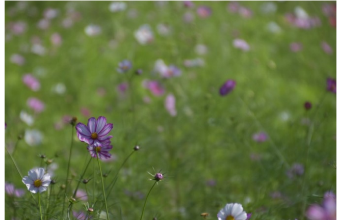
↑野に咲くコスモス