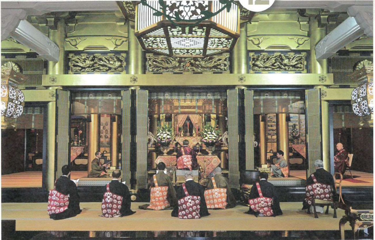
西徳寺 報恩講勤修 詳細は3ページ