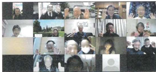
セミナー最後に集合写真を撮りました