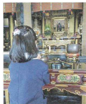
長女が無事、小学校に入学しました

なお、西徳寺ホームページでの閲覧、メールでの送付もできます。ぜひご利用ください。 (仲井 真裕 記)