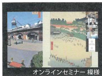
オンラインセミナー 模様