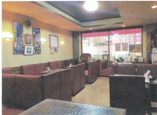
最大30人入れる店内