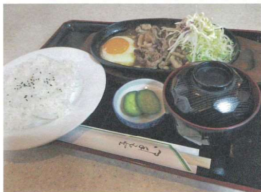
一番人気の生姜焼き定食