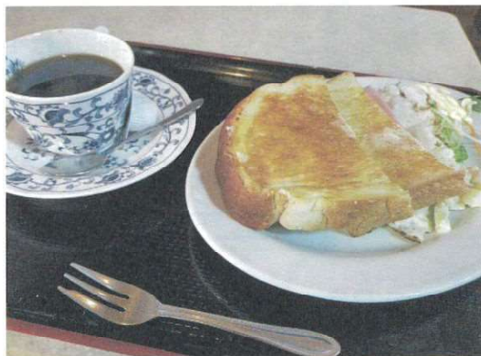
モーニングセット