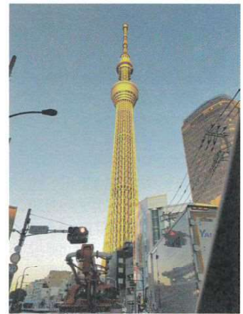
朝日に照らされ金色に輝くスカイツリー

小学生の頃、毎年冬休みの宿題で書初めに新年の抱負を書いていたのを思い出します。何を書いたかは覚えていませんが、とても大事な習慣だったように、今になって思います。自分にとっての一年の柱となる言葉を表明する。言葉通りの生活が送れなかったとしても、一年を振り返る時に自分の姿を顧みる指針になるのではないのでしょうか。大きな災害や疫病に日々戦々恐々とし、暗中模索の今だからこそ、一年の中心となる初心を明らかにすることは、大切なことのように感じます。(蓮井 邦宗 記)