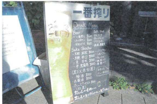
お酒のメニューもたくさん