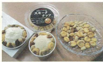
スモークミックスナッツ 300円~ オリジナルアイス 450円~

台東区三ノ輪 1-21-4 文昌堂ビル 1F 日比谷線三ノ輪駅 1b 出口徒歩 1分