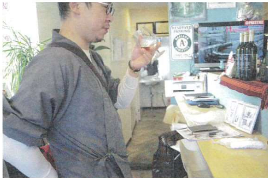
1本30万円というブランデーを、一口いただきました