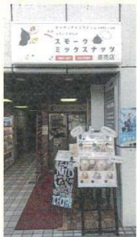
三ノ輪駅すぐ 歩道橋のわきにあります

スモーキーなナッツに合わせて、特注で作ってもらったというオリジナルアイスもあり、お酒の入ったブランデーとラムレーズンアイスとの相性は抜群です。他にもバニラ・レアチーズ&ラズベリー・キャラメルと、全部で5種類あります。ぜひお試しを!