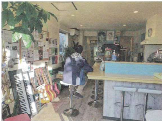
楽器がいっぱいの、おしゃれな店内