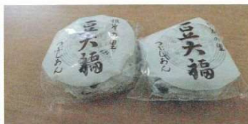
一番人気の豆大福 こしあんや、季節の大福もあります