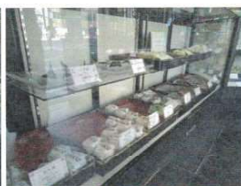
どれもおいしそうで、目移りします