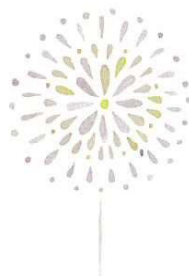
お礼にと、可愛い絵をいただきました