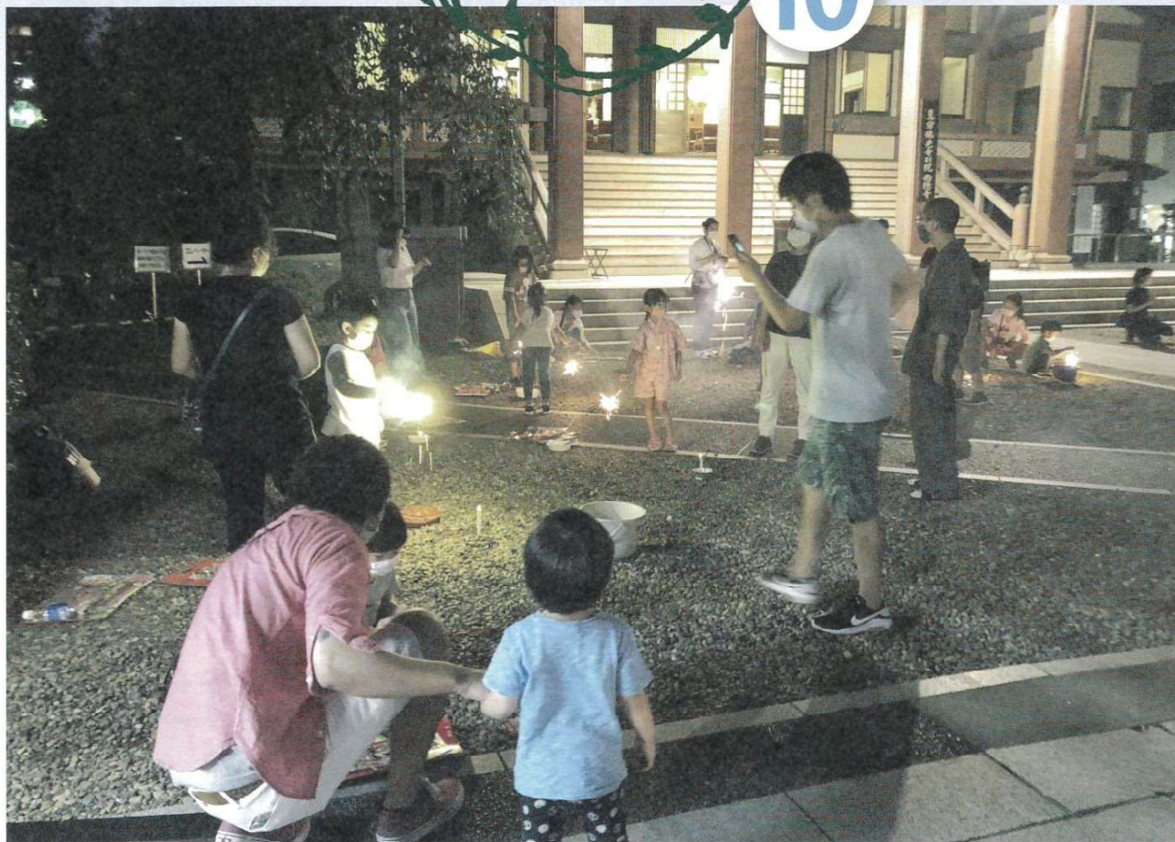
千束幼稚園夕涼み会(花火)の様子