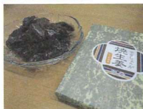
おすすめの焼生姜