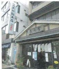
前号で紹介した金太郎飴本店はお隣さんで、親せきなんだそうです