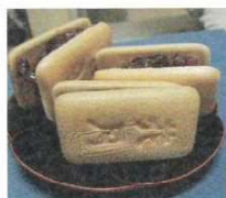
直前にはさむ、自慢の花月最中