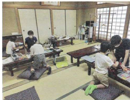
ロボット教室の様子