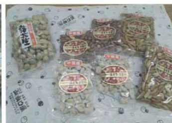
写真手前は夏目漱石の愛した落花糖