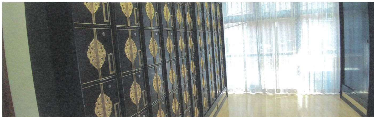
ロッカー式納骨壇(左)、棚形式納骨壇(右)