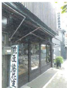
戦前から変わらぬ佇まい