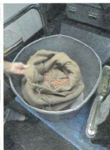
千葉県八街産の落花生