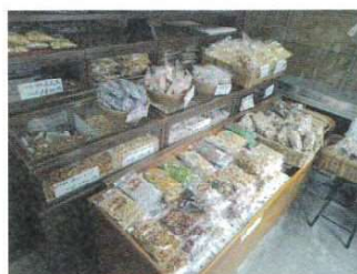
どれにしようか迷います