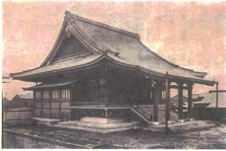
昭和5年西徳寺本堂新築落慶