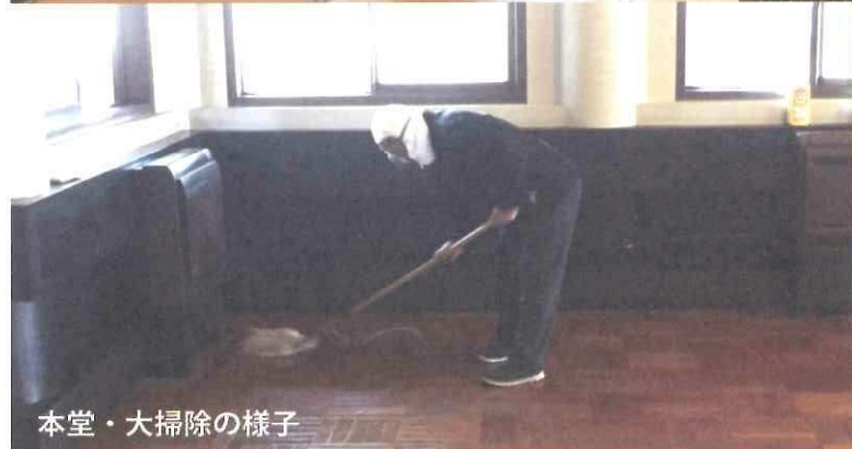
本堂・大掃除の様子