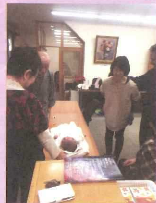
こんにちは舞ちゃん♪