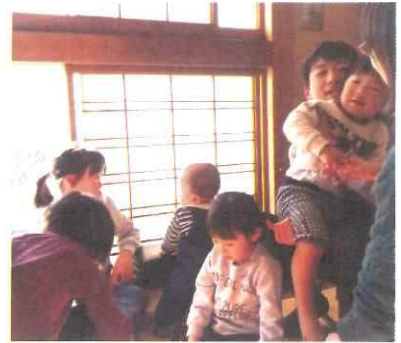
子供達は大はしゃぎ♪

平成最後となる歳暮法要・修正会（新年の法要）を、ご門徒様と一緒に勤め、新たにという気持ちが出来てくる。