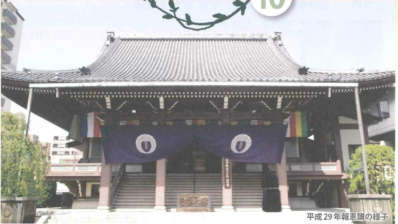
平成29年報恩講の様子