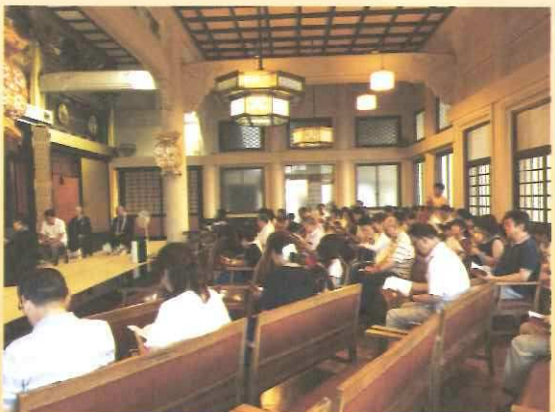
最初にお勤めをしました

今年も参加者の皆様には、後片付けまでお手伝いをいただき、誠にありがとうございました。今後もまた笑顔あふれる活動をしてまいります。(仲井 真裕 記)