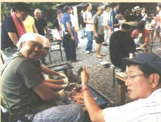
本当に暑かったです