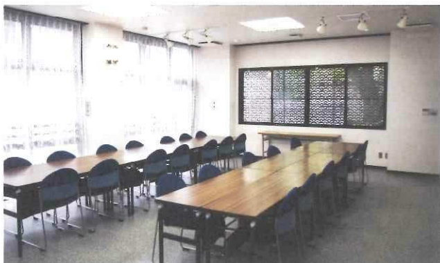
普段は休憩所としてご利用できます。

西徳寺でお葬式を挙げたい、しかし本堂ほど大がかりにはしたくない。そういう方のために、西徳寺では第二会館をご利用いただけます。駐車スペースも有り、またご葬儀まで故人様をおあずかり(ご安置)するお部屋もございます。詳しくは寺務所までお尋ねください。