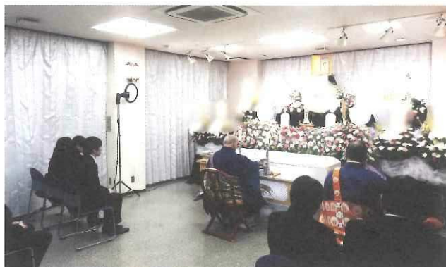
このような形でお勤めいたします。