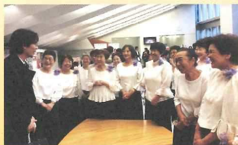
演奏後の様子(昨年)

8月12日(日) 16:05~ 浅草公会堂にて 混声合唱団「エコー」が 出演します。 入場無料、ぜひお越しください。