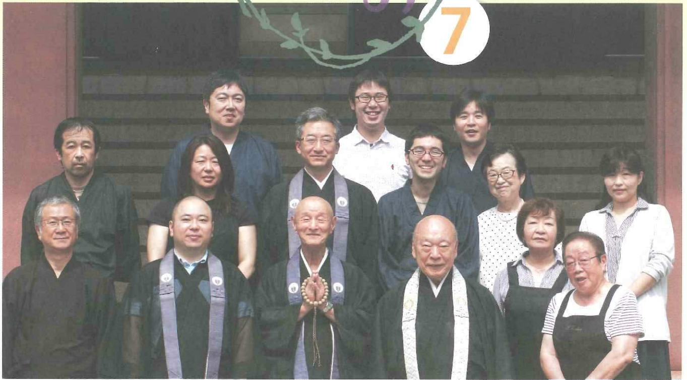
"お気軽に声をかけてください"