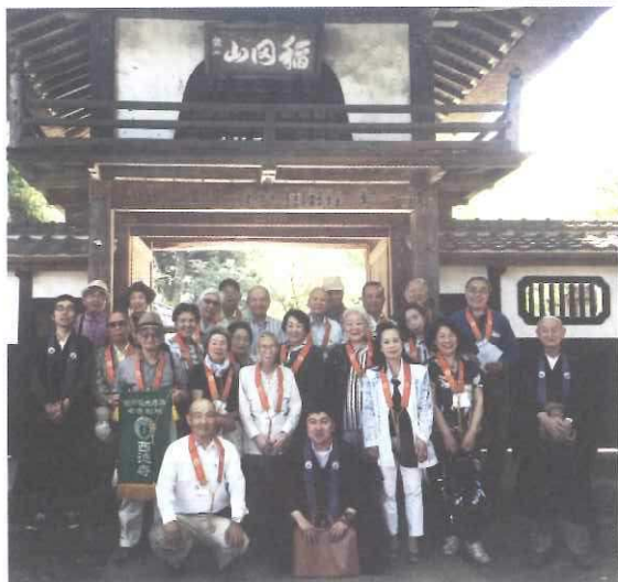
稲田・西念寺にて