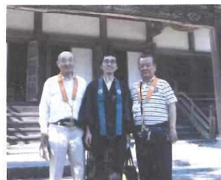
写真提供 加藤晃司様(左)