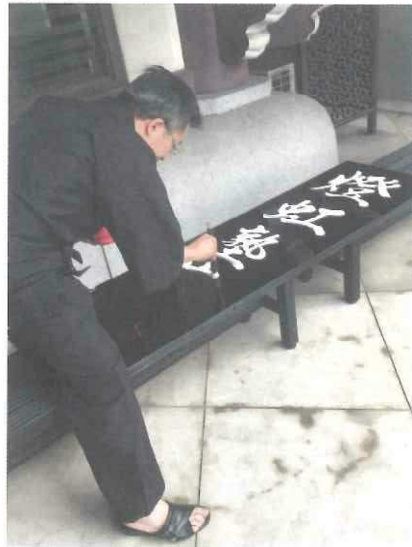
あっという間に書き上げます！