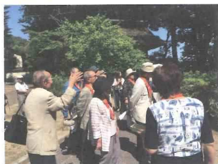
ガイドさんの説明に真剣に聞き入りました