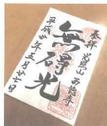
② 今回は御朱印をお配りしました(城西)