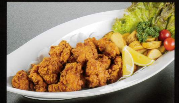
23411 唐揚げポテト 4,800円 (税込5,280円)