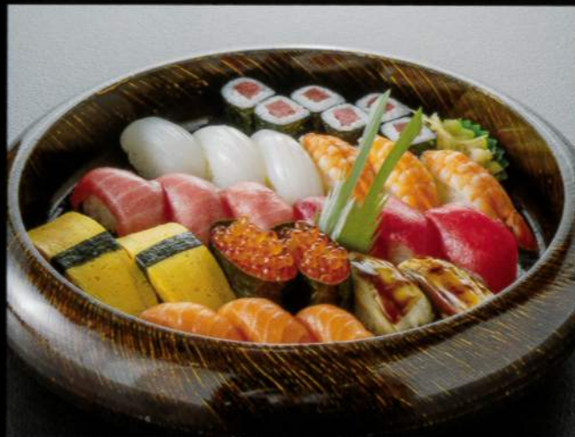
21104 握り寿司〈3人盛〉 6,000円 (税込6,600円)