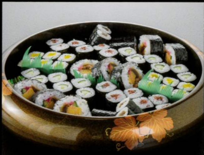
23131 巻き寿司〈3人盛〉 5,000円 (税込5,500円)