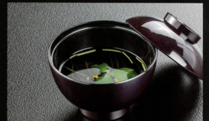
21615 吸物 300円 (税込330円)