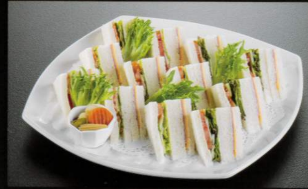
23418 ミックスサンド 4,000円 (税込4,400円)