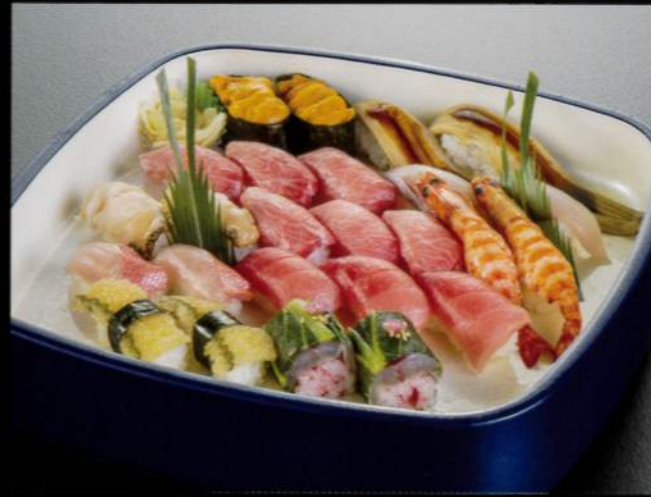
23101 極上握り寿司〈3人盛〉 13,500円 (税込14,850円)