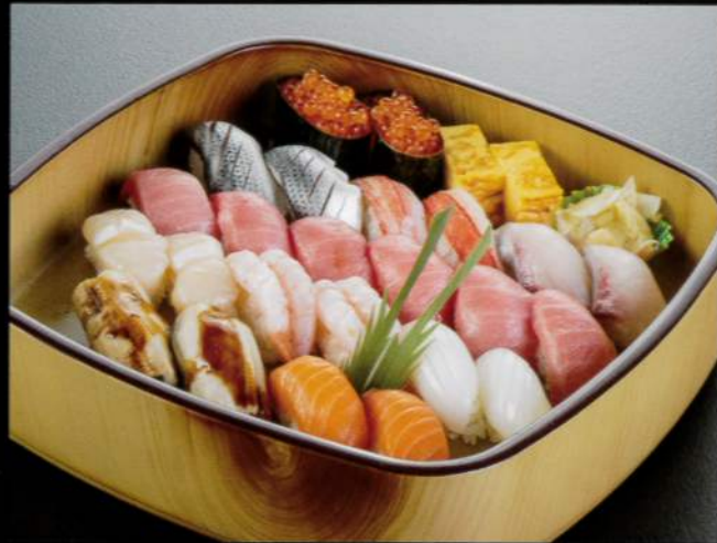
21103 上握り寿司〈3人盛〉 7,500円 (税込8,250円)