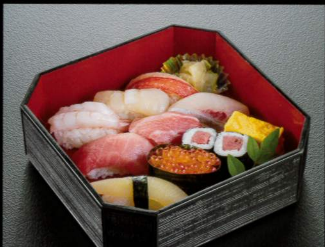
23141 御導師様握り寿司 3,200円 (税込3,520円)