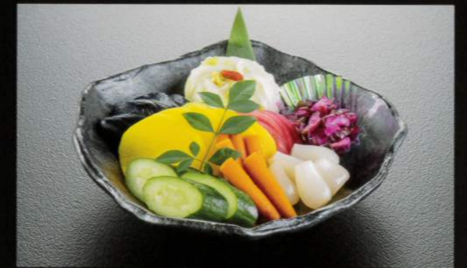
23415 漬物 2,300円 (税込2,530円)