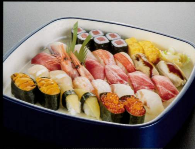
23102 特上握り寿司〈3人盛〉 10,000円 (税込11,000円)