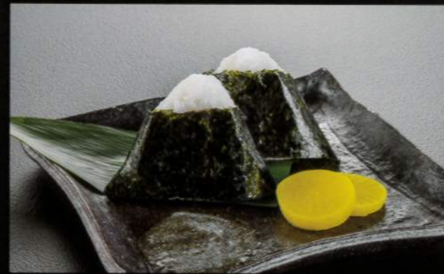
21612 おにぎり2個 400円 (税込440円)