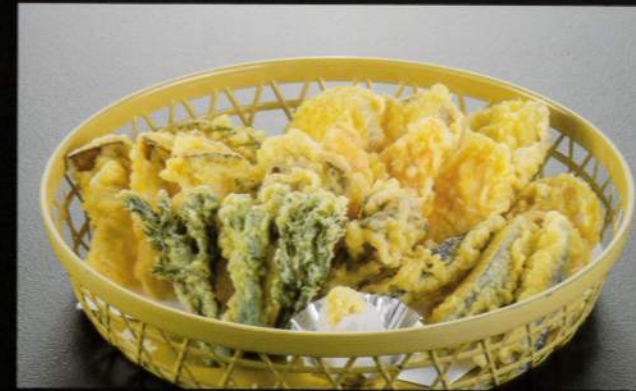
23331 野菜天ぷら〈3人盛〉 4,800円 (税込5,280円)