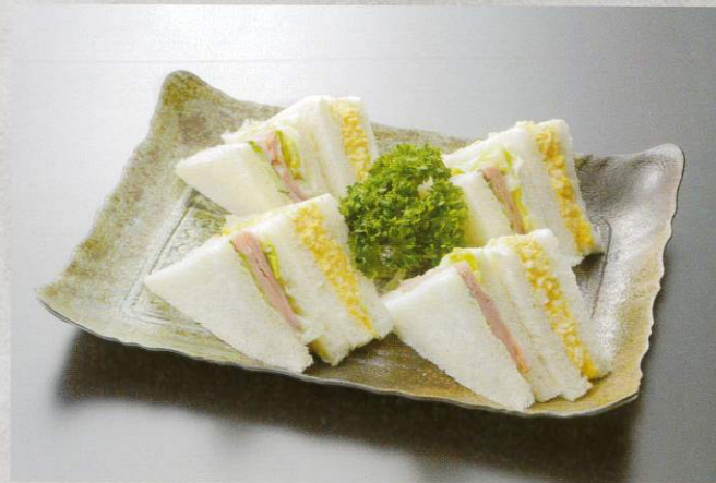
サンドイッチ1人前2個 300円 (税別) ※写真は4人盛りです。