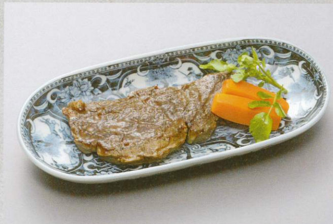
牛ステーキ 2,200円 (税別)