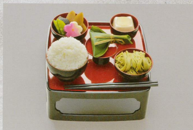
供養膳 2,000円 (税別)