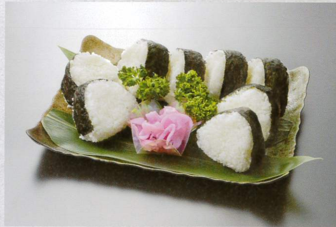
おにぎり 1個 200円 (税別)