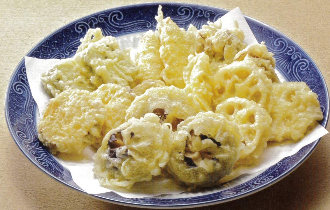
精進揚げ 3人盛 4,200円(税別) 5人盛 7,000円(税別)