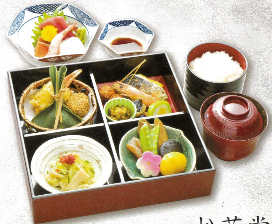
松花堂弁当 4,800円(税別)