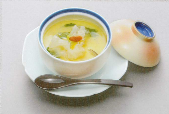
茶わん蒸し 700円 (税別)