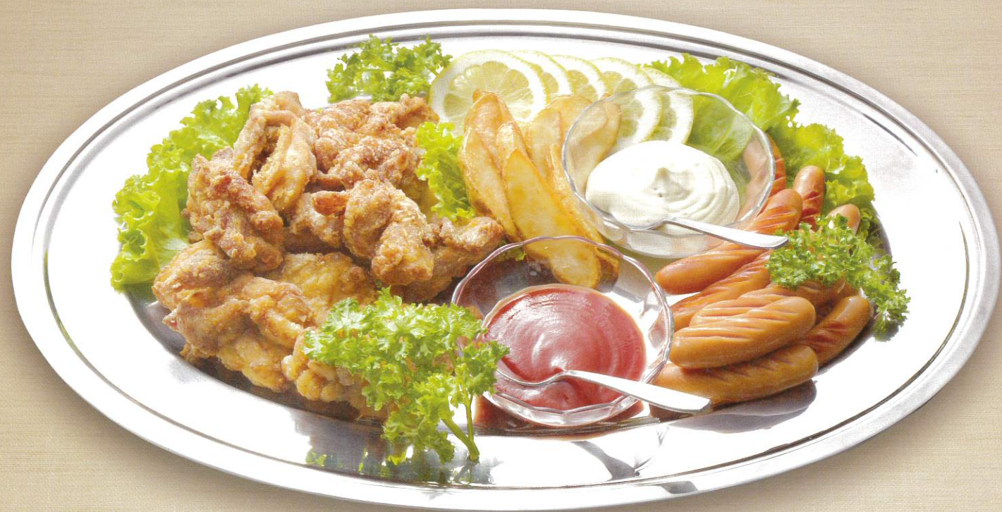
唐揚げ盛合せ 6,500円(税別)