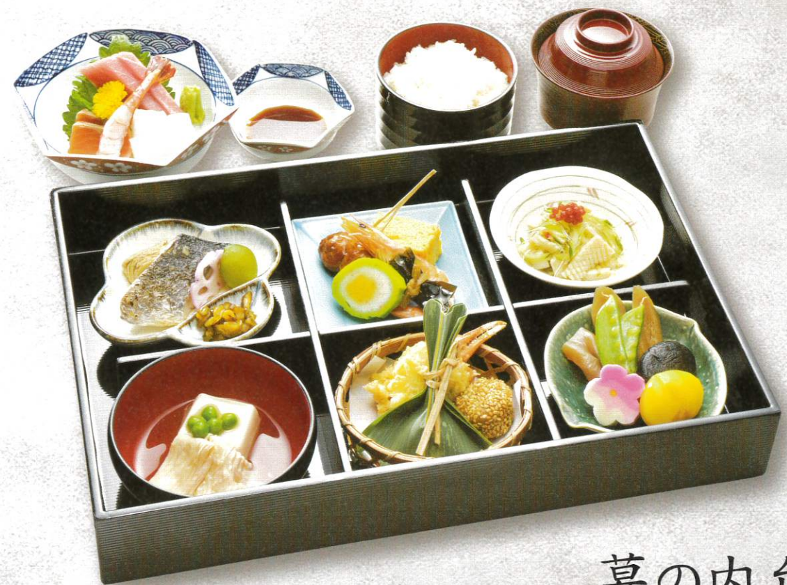
幕の内弁当 5,800円(税別)