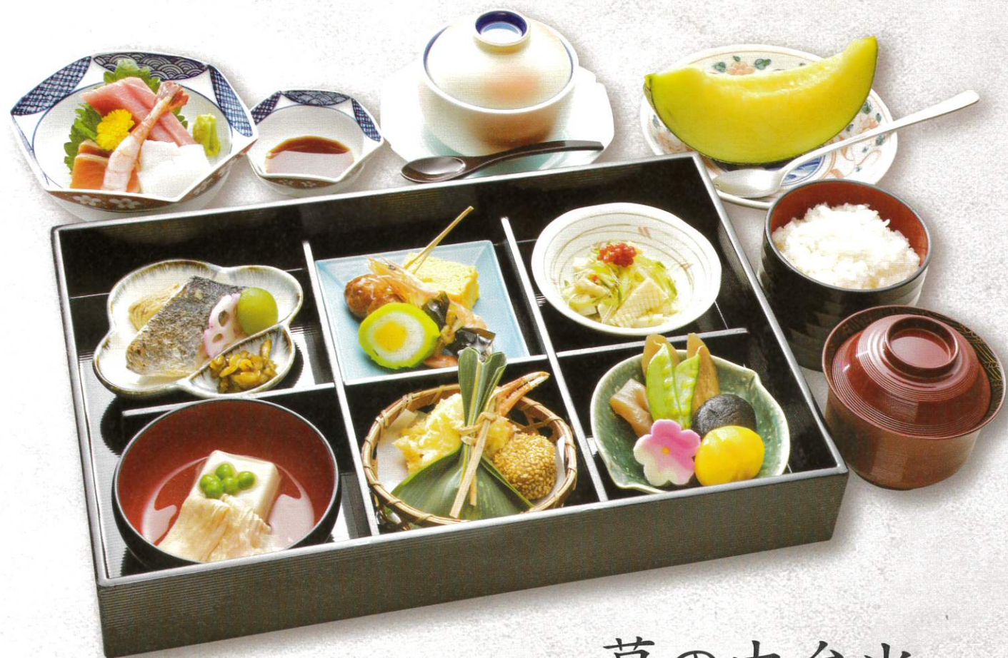
幕の内弁当 7,500円(税別)